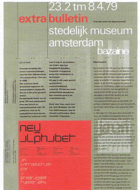
Bulletin Stedelijk Museum, waarvoor Crouwel het basis-stramen ontwierp en New Alphabet, 1967.

le productie" als ondeugdelijk en kunsthistorisch afzweert. Het is de vraag of Crouwel daarin nog fungeert als onderwerp of slechts meewerkend voorwerp. De kritiek is echter bescheiden want Crouwel is echter bescheiden want Crouwel is als geheel een prachtvol document. 1