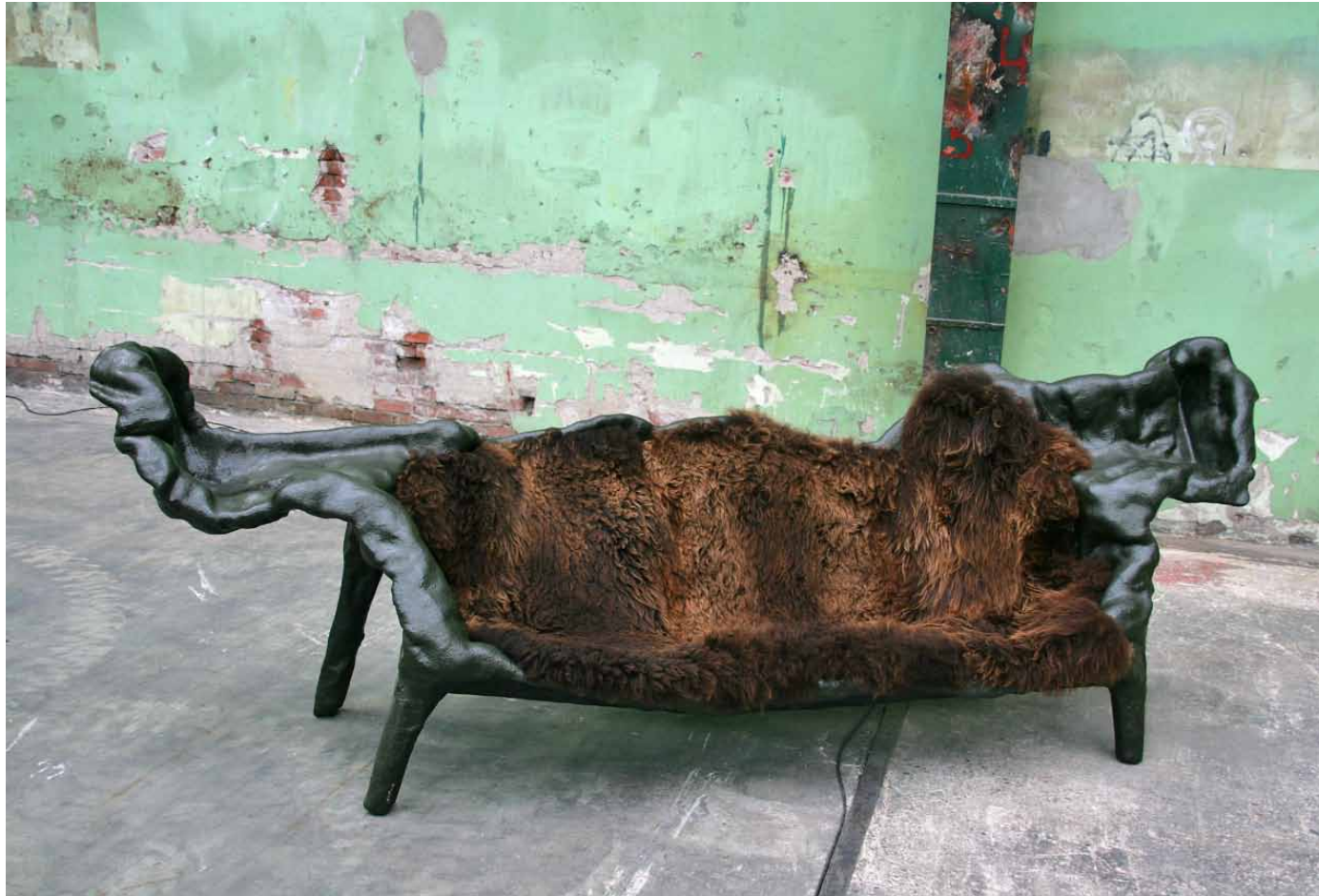
Revolt canapé, schuim, hout, koeienbont, 2009