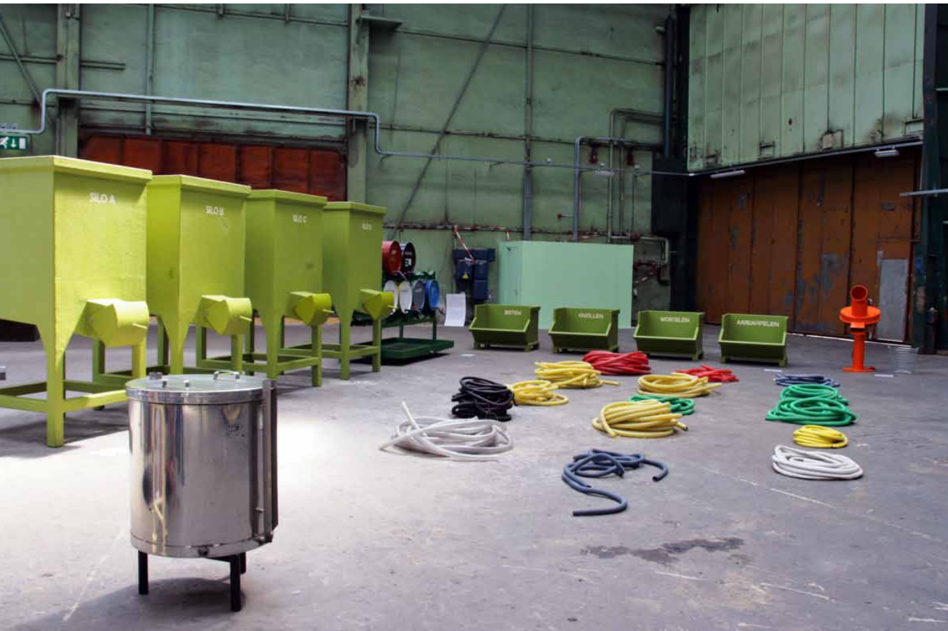
The Feeder (Cooker), 2003, Technocrat- installatie

te voeren. Een berg poppenlijken vormt zich tot een ornamentale canapé.