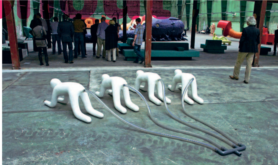
Arschmänner , schuim, 2004, Technocrat-installatie

Welkom in Infernopolis, de Hellestad die Joep van Lieshout als Gesamtkunstwerk bouwde in een voormalige Onderzeebootloods. Hier in de Rotterdamse haven zoekt de kunstenaar/vormgever de grenzen op tussen goed en kwaad, leven en dood, realiteit en fictie.