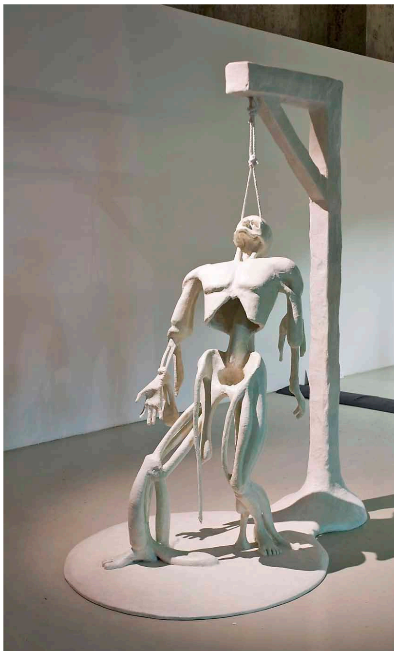
Uomo Analyticus, 2009, Cradle-to-Cradle installatie

De meubels van Joep van Lieshout zijn te koop via Vivid, Rotterdam vividvormgeving.nl