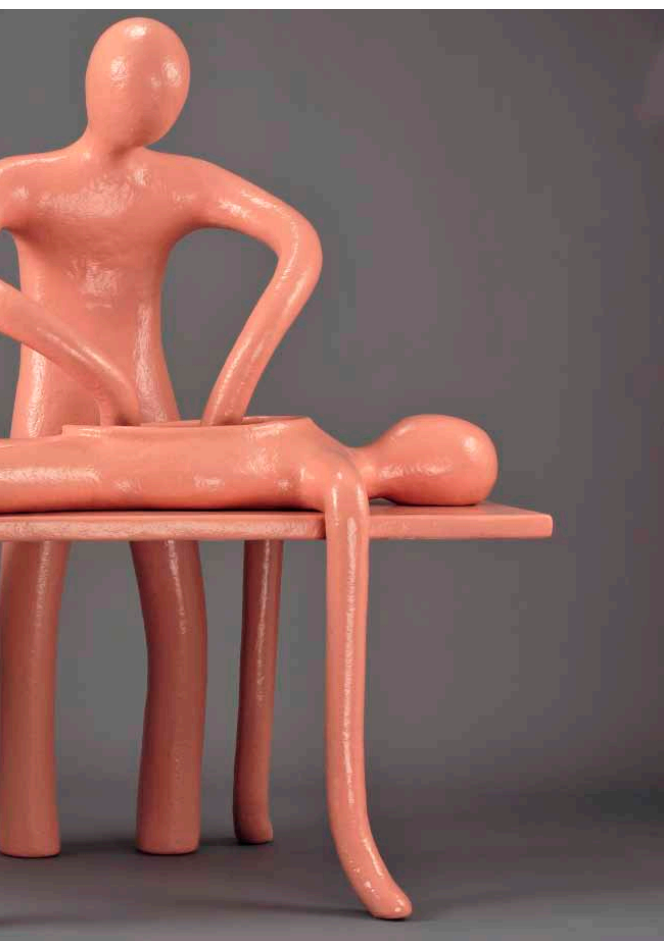
Snijtafel, hout, papier-maché, vernis, 2009, Cradle-to-Cradle installatie

een van de barokke herdenkingsmonumenten aan de fictieve Derde Wereldoorlog: "Omdat heldendom vandaag de dag nog maar ver te zoeken is." De rondleiding eindigt in een hal met alleen de nieuwe, nog naamloze collectie modulaire zitobjecten. Voor meer daglicht rolt Van Lieshout manhaftig de torenhoge schuifdeur open. Gewillig poseert hij daarna op een ook qua kleurstelling smaakvol bankje. "Die armlegger mag zwaarder. Verder is-ie perfect. Fijne stof. In leer zouden ze ook mooi zijn. Het is prettig om via jullie een nieuw publiek met deze betaalbare meubels te bereiken."