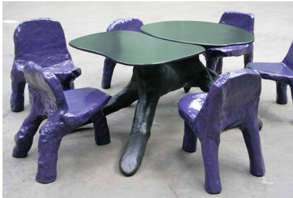
Revolt tafel en stoelen, schuim, 2009