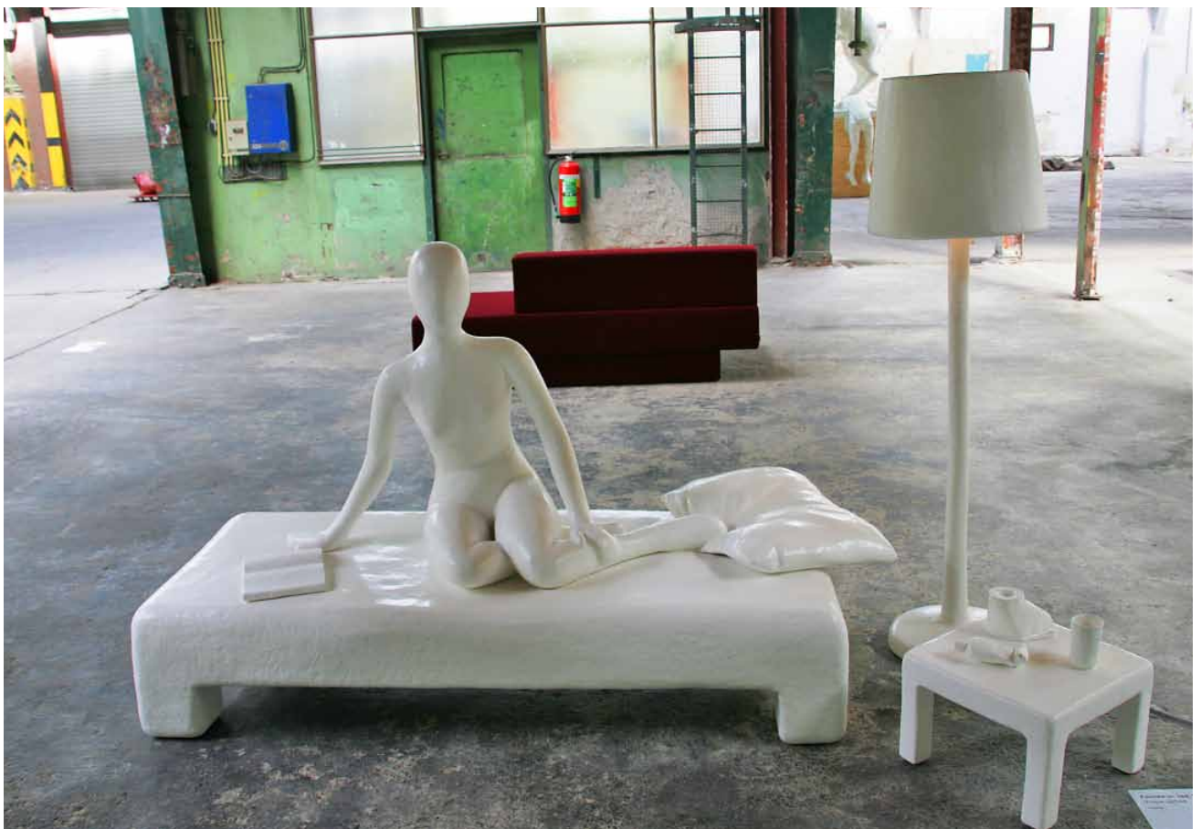
Vrouw op bank met schemerlamp, schuim, 2009