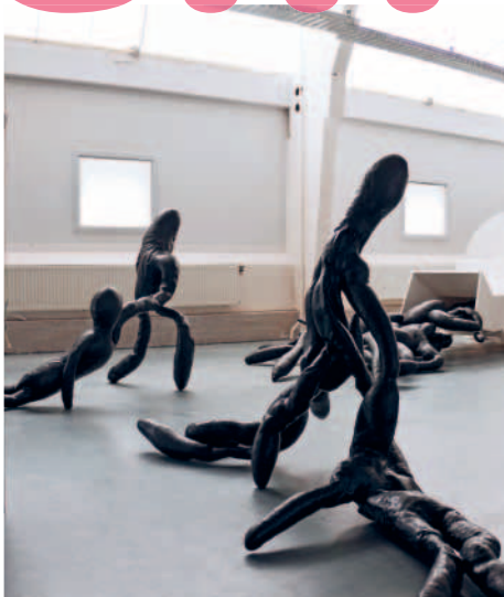
Gehaktmolen met lijken schuim, 2009, Cradle-to- Cradle installatie