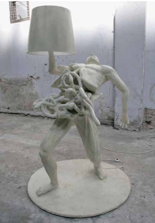
Llomo Illuminatus, staande schemerlamp, 2010