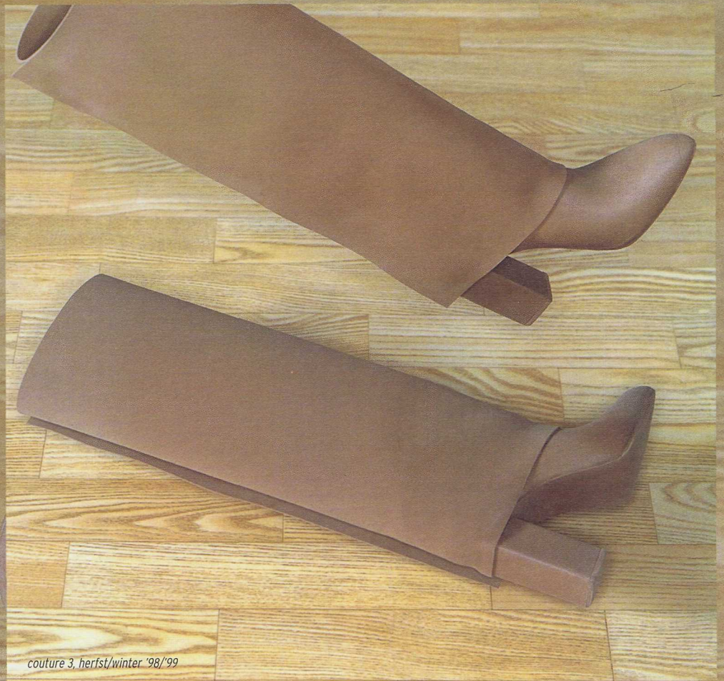
couture 3, herfst/winter '98/'99

Red uitnodiging: design: Goodwill, foto: Maurice Schellens