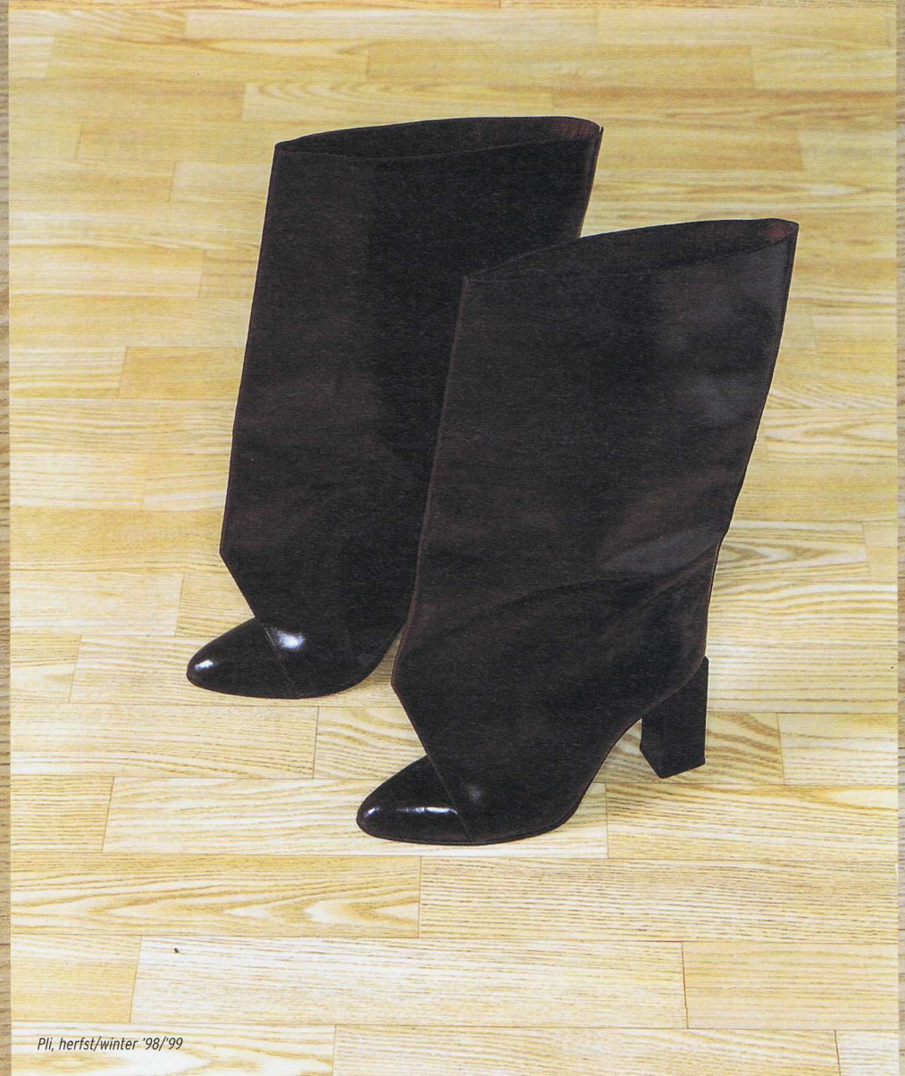
Pli, herfst/winter '98/'99