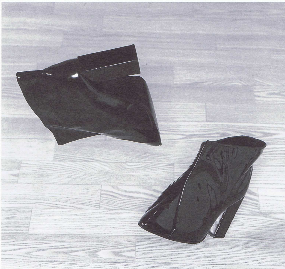
Chinois, herfst/winter '98/99

Stevens: 'Doordat mijn schoenen vaak ongebruikelijke vormen hebben - ontstaan vanuit moulages - is het moeilijk een fabrikant te vinden die mijn collecties kan produceren. Men is gewend aan traditionele patronen. Tot voor kort maakte ik alles zelf, met hulp van twee orthopedische schoenmakers. In Nederland zijn er praktisch geen damesschoenen-