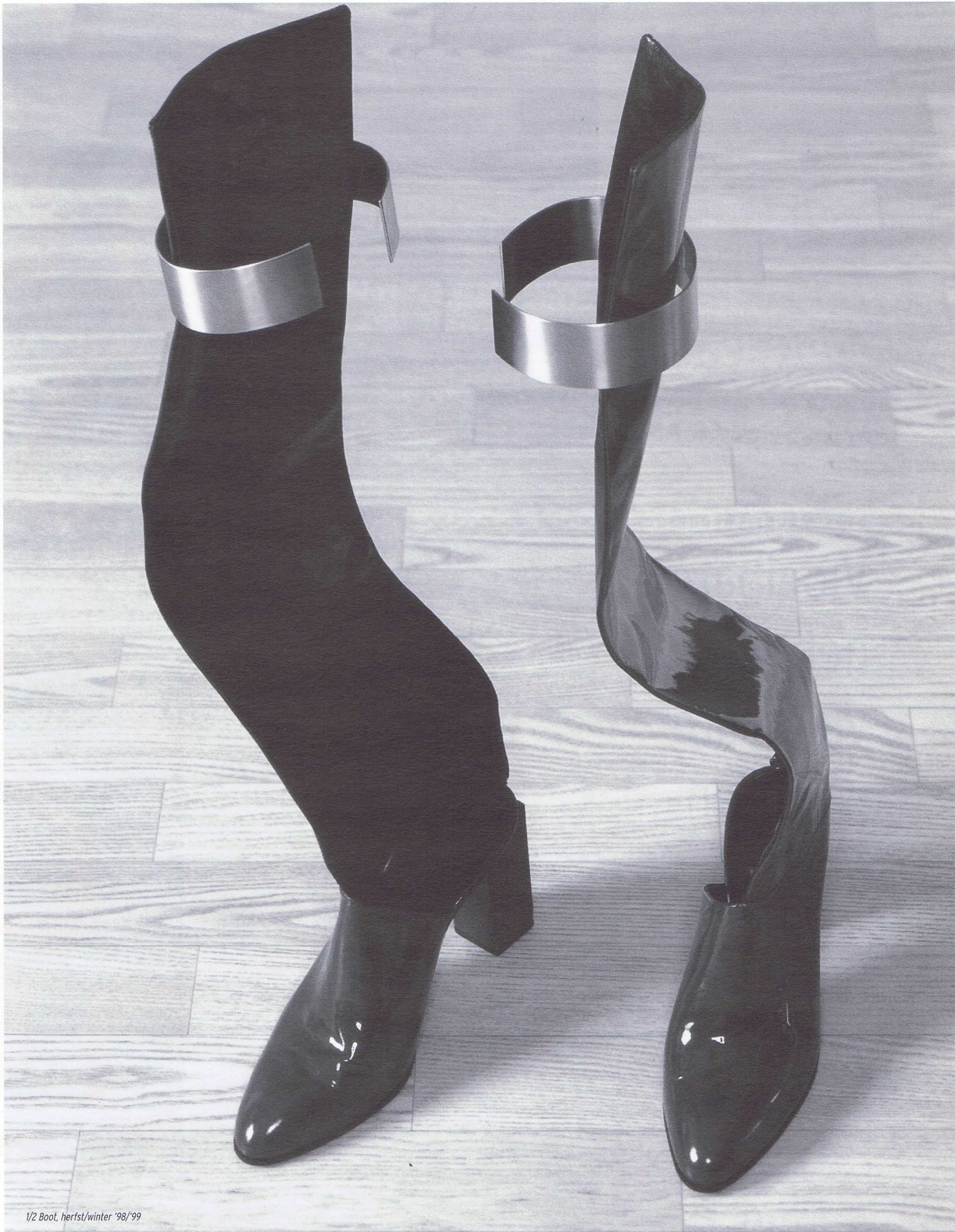
1/2 Boot, herfst/winter '98/'99