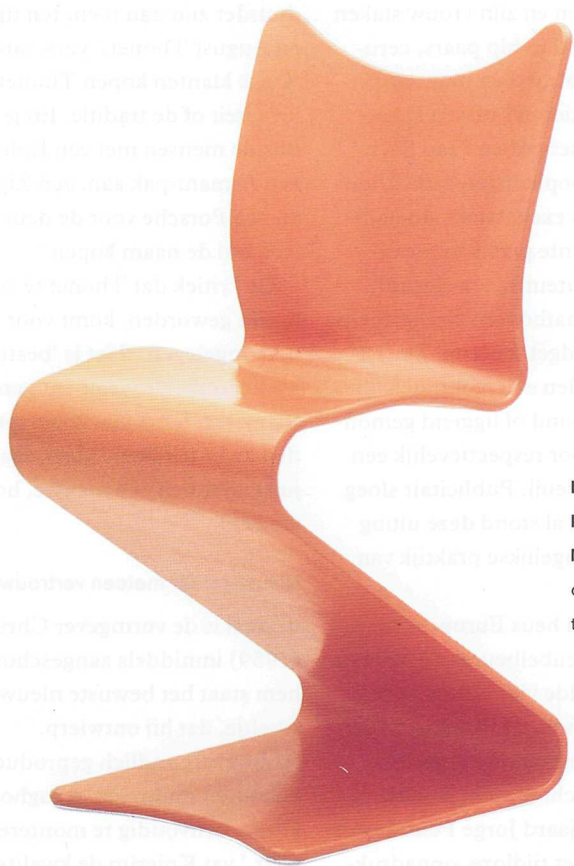
Laminaat houten slingerstoelen van Verner Panton, 1967. De sensatie van de Keulse Meubelbeurs. / Laminated wood suspension chair from Verner Panton, 1967. They were the sensation of the Köln Furniture fair.